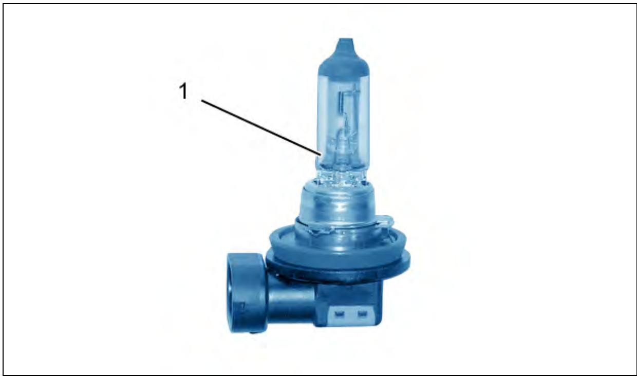
图 : C5EH05ED